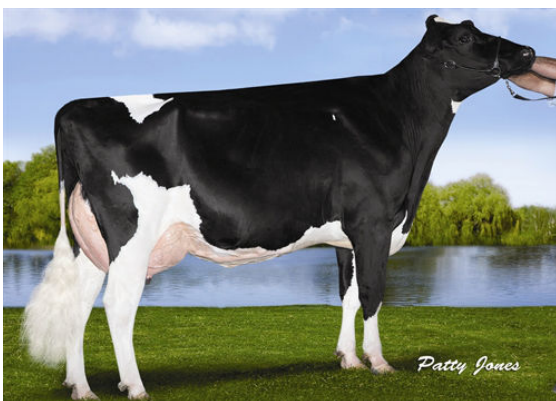
RANSOM-RAIL FACEBK PARIS FOURTH DAM