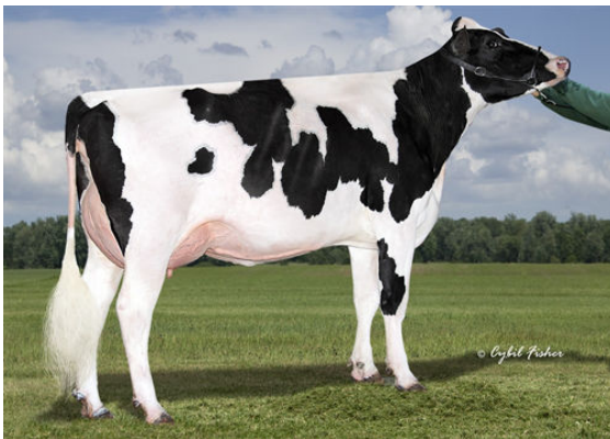
SIEMERS GRT PARINI 28262 DAM